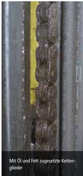
Mit Öl und Fett zugesetzte Ketten-glieder

Bei diesem Reinigungsverfahren werden Trockeneis-Pellets aus gefrorenem Kohlendioxid (-79 °C) sehr hoch beschleunigt und auf die zu reinigende Oberfläche gestrahlt. Bei bestimmten Brandschäden ist es möglich, die ersten Reinigungsvorgänge schonend mit unserem Eispellets-Strahlverfahren vorzunehmen. Bisher hat sich die Methode nach Brandereignissen in Elektroanlagen oder in Verteilerschränken von Kommunikations-