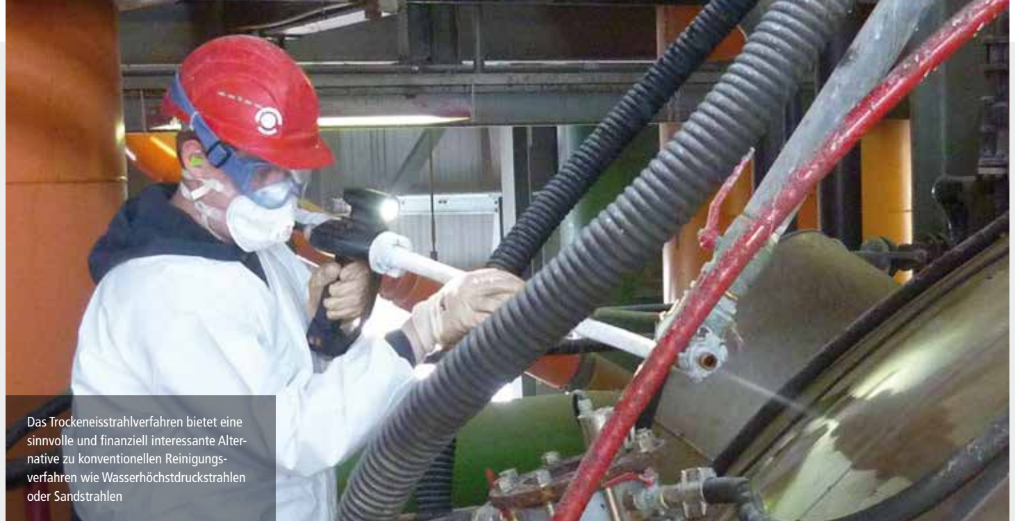
Das Trockeneisstrahlverfahren bietet eine sinnvolle und finanziell interessante Alternative zu konventionellen Reinigungs-verfahren wie Wasserhochdruckstrahlen oder Sandstrahlen

systemen bestens bewährt! Dabei kommt es zu einem thermischen Schock, die Oberfläche kühlt sofort ab, und die Beschichtung bzw. die Verunreinigung zieht sich zusammen. Durch diese plötzliche Volumenreduzierung bilden sich Risse – das Material wird spröde.