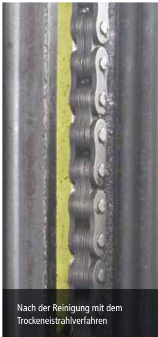
Nach der Reinigung mit dem Trockeneisstrahlverfahren